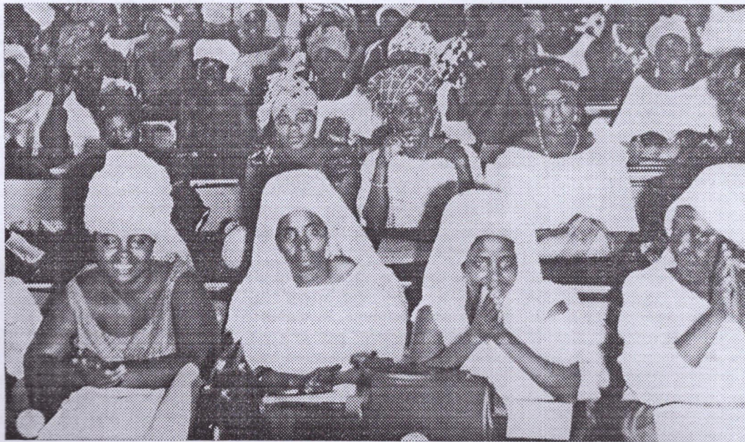
Le séminaire des Femmes du P.D.G. de Conakry II poursuit ses travaux.