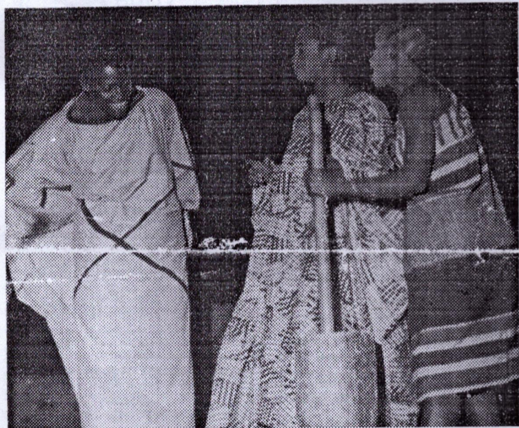
Le ballet intitulé «Au Bagataï»

Les chants, les danses qui s'entrechânaient dans une mise en